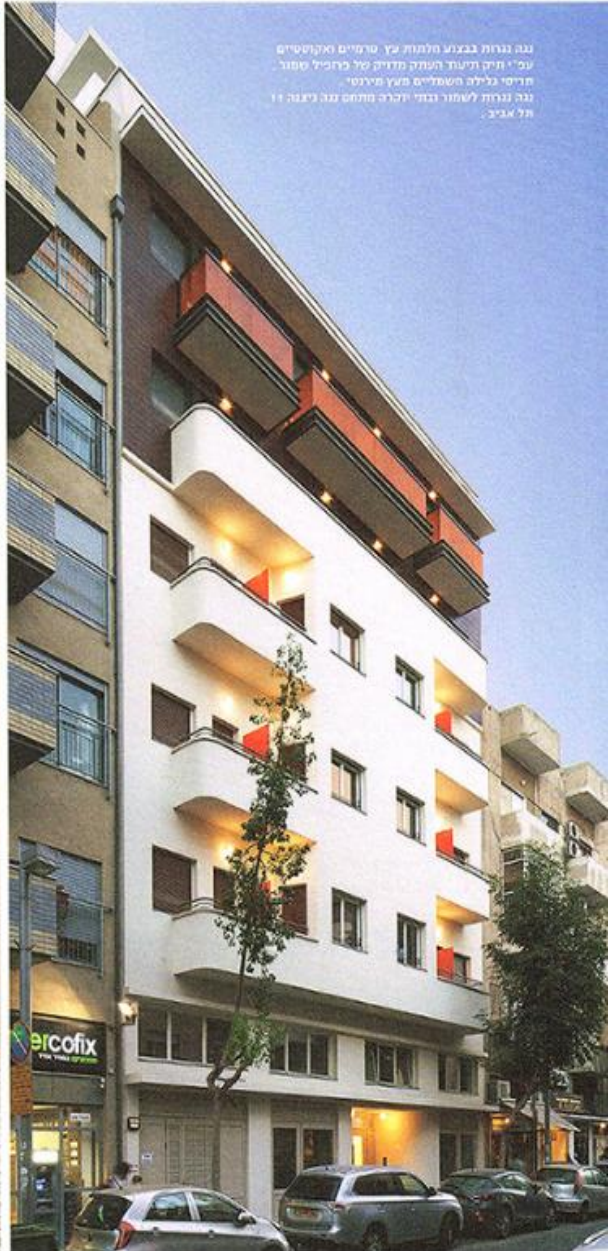
נבנה בגובה מוצנע מלפניו עץ. טרמייט ואקוסטיקום עם יתרון העתק מדויק של פרזכיל סופר. מדיסי גליליה השפיעים מעץ מירנסי. נבנה בגובה לשומר בבני יזכרה מתחם נבנה ביצוגה 11 תל אביב.